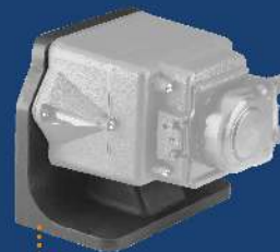
Soporte EC304 Para la instalación horizontal o en la pared